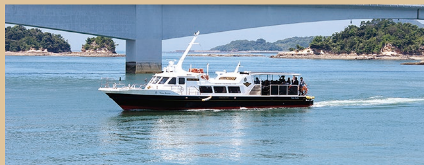
葬儀代金に海洋散骨まで含まれた 海送りプラン 285,000円～(税別)

葬儀費用でお困りの方、どのような事でもご相談ください。必ずお力になります。 お葬儀後のアフターサポートも執り行っております。